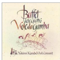
デザイン 石下裕子