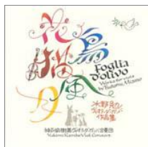
デザイン 石下裕子

演奏：神戸愉樹美 小澤絵里子 野口真紀 橋爪香織 櫻井茂 曲目：ホルボーン、パーセル、ギボンズ、J. S. バッハ、佐藤容子、水野勉、廣瀬量平の作品他